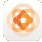
مصرف عجمان Ajman Bank