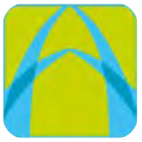
بنك دبي التجاري CBD