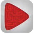
بنك أبوظبي التجاري ADCB

التحويل عبر تطبيقات البنوك Online Banking Transfer