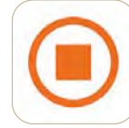
مصرف الهلال Al Hilal Bank